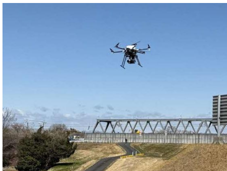
橋梁などの外観点検（新幹線）