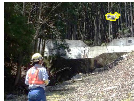
異常時における現地確認（在来線）